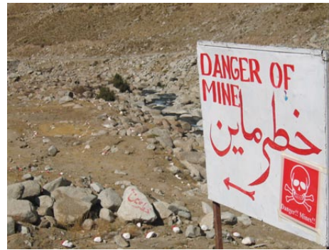
Kriegserinnerung und Aufräumarbeit überall in Afghanistan

All diese drei Gesichter - das ist das verwirrende - überlagern sich immer wieder und existieren gleichzeitig, in den Dingen und in den Menschen. Es ist ein widerwärtig kurz vor unserem Abflug in Kabul entdecken. Auf einem der vielen Hügel, die um diese Stadt empor schießen, steht oberhalb einer Müllhalde ein großes leeres Schwimmbecken mit einem Sprungturm, gebaut während der russischen Besatzungszeit. Es hätte wohl einmal als Ausflugsort für Familien dienen sollen, doch es kam anders. Das Becken wurde nie mit Wasser gefüllt. Stattdessen zeugen Einschusslöcher am mittlerweile bröckelnden Beton von Kämpfen, die während des Bürgerkriegs statt Wasserwellen auf diesem Berg wogten. Auch die Taliban, munkelt man, hätten diesen als Platz der Freude geplanten Ort für Massenerschießungen missbraucht. Bewiesen ist das nicht. Doch als wir oben auf dem Berg ankommen, spielen Kinder in dem noch immer leeren Becken, sie fangen einander und schaukeln an einem langen Seil wild rudern durch die Leere. Wenn ihr lautes Lachen und Schreien von den blanken Wänden zurückgeworfen wird, scheint es, als erobere sich der Spaß und Lebenswille diesen surrealen Ort, dieses leere Schwimmbad auf einem Berg, in einer neuerlichen Zweckentfremdung als Spielplatz zurück. Schlecht fühlt sich das nicht an.