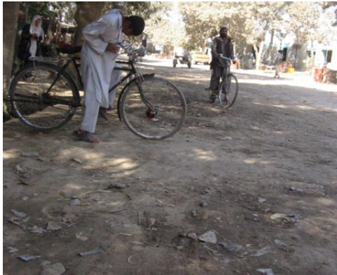
Guten Grund, Fahrräder zu reparieren, gibt es bei den afghanischen Straßenverhältnissen allemal.