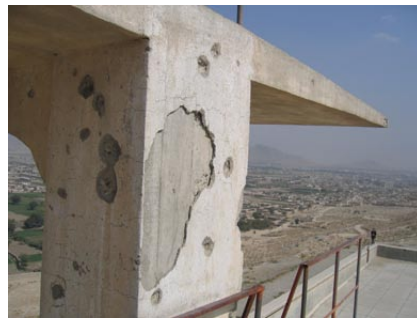
Der “Schwimmbadberg” in Kabul: bedrückende Stille und lautstarke Freude

Neben dem Schwimmbad steht eine übergroße Reklametafel, doch an ihr kleben keine Werbebotschaften. So als gäbe es nichts Erwähnenswertes, schaut sie mit ihren leeren Holzplanken hinunter auf das Tal, steht still, als warte sie darauf, dass die Stadt es irgendwann lohnenswert fände, zu ihr empor zu schauen. An diesem Ort, an dem Verfall, Stillstand und Aufbruch sich wie in einem Mikrokosmos zu einem untrennbaren Ganzen kumulieren, ist Afghanistan ganz bei sich.