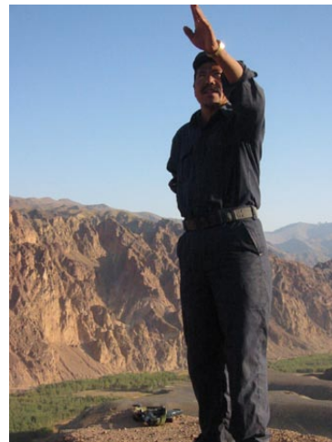
Ein Guard legt seine Kalaschnikow höchstens zur gestrennten Wissensvermittlung aus der Hand.