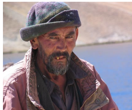
Die vielen Gesichter Afghanistans

Das Afghanistan des Aufbruchs - es ist das Land der lachenden Kinder, die oftmals überraschend gut englisch sprechen, die auf den Trümmern ihres Landes zu spielen wissen. Es ist das Land der Hilfsprojekte, die viel Geld und Energie in die Städte tragen, die wie